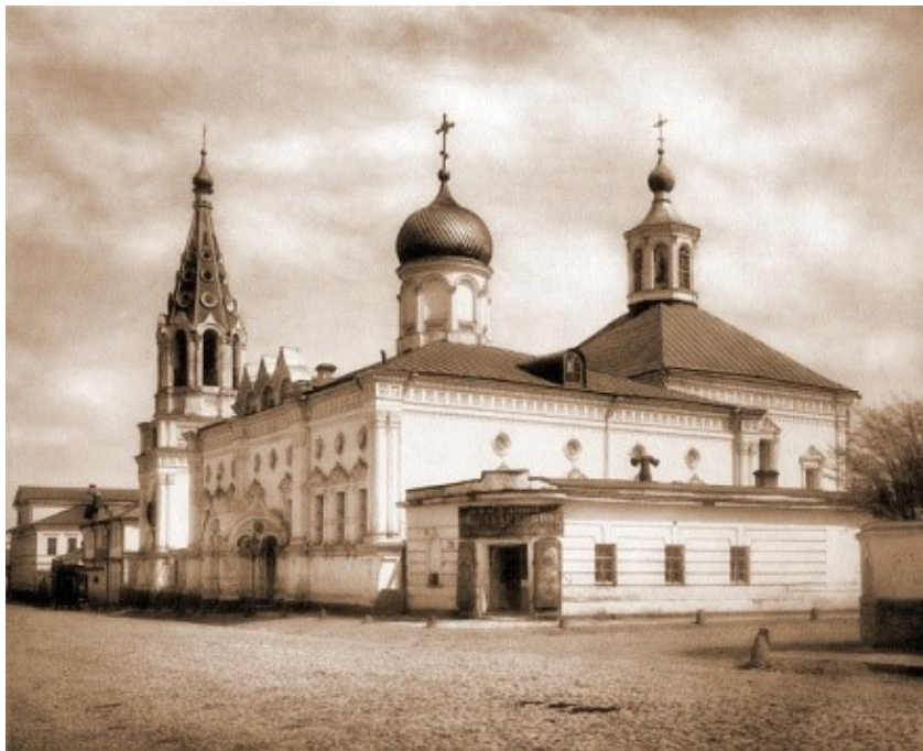
Церковь Петра и Павла на Якиманке 1882 год.