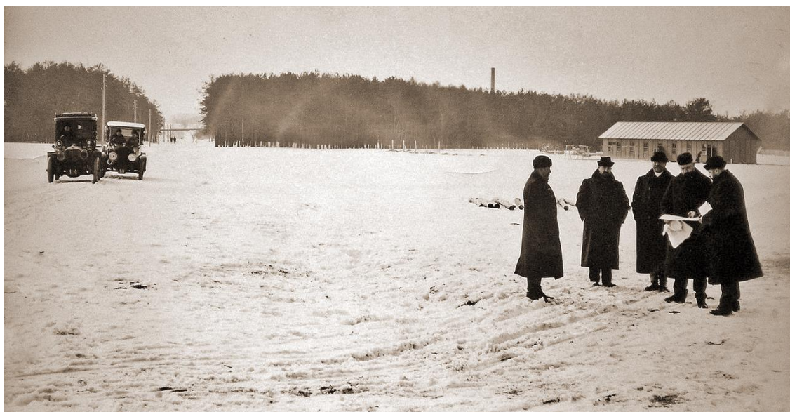
Сергей Павлович и Степан Павлович Рябушинские обсуждают план строительства АМО. Тюфелева роща, 1916 год.