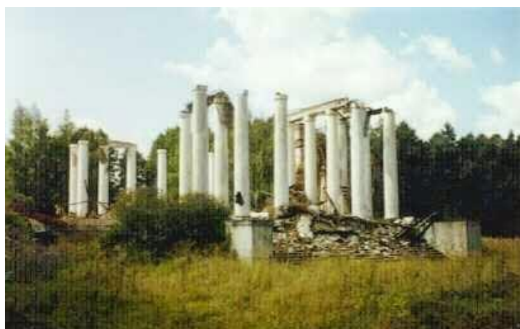
Современный вид усадьбы «Лубеньково»