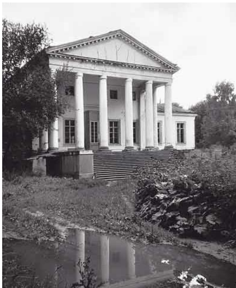
Усадьба «Лубеньково». 1960-е годы.